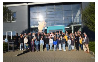
30 Kinder, zusammen mit ihren Eltern, hatten viel zu entdecken, beim „Türen auf mit der Maus“ Tag.

Die WITTENSTEIN SE entwickelt Produkte, Systeme und Lösungen für hochdynamische Bewegung, präziseste Positionierung und intelligente Vernetzung in der mechatronischen und cybertronischen Antriebstechnik.