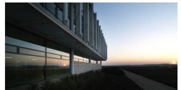
Die WITTENSTEIN Innovationsfabrik in Igersheim-Harthausen

Die WITTENSTEIN SE entwickelt Produkte, Systeme und Lösungen für hochdynamische Bewegung, präziseste Positionierung und intelligente Vernetzung in der mechatronischen und cybertronischen Antriebstechnik.