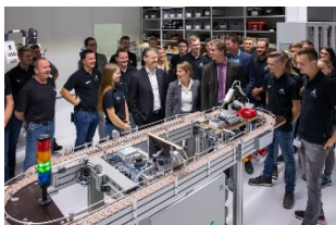
08_ Im neuen Mechatronik-Werkstattbereich der WITTENSTEIN: Auszubildende, Ausbilder, Unternehmensleitung und Gäste der Eröffnungsfeier am 14. November