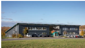
01_ Die WITTENSTEIN talent arena: Außenaufnahme