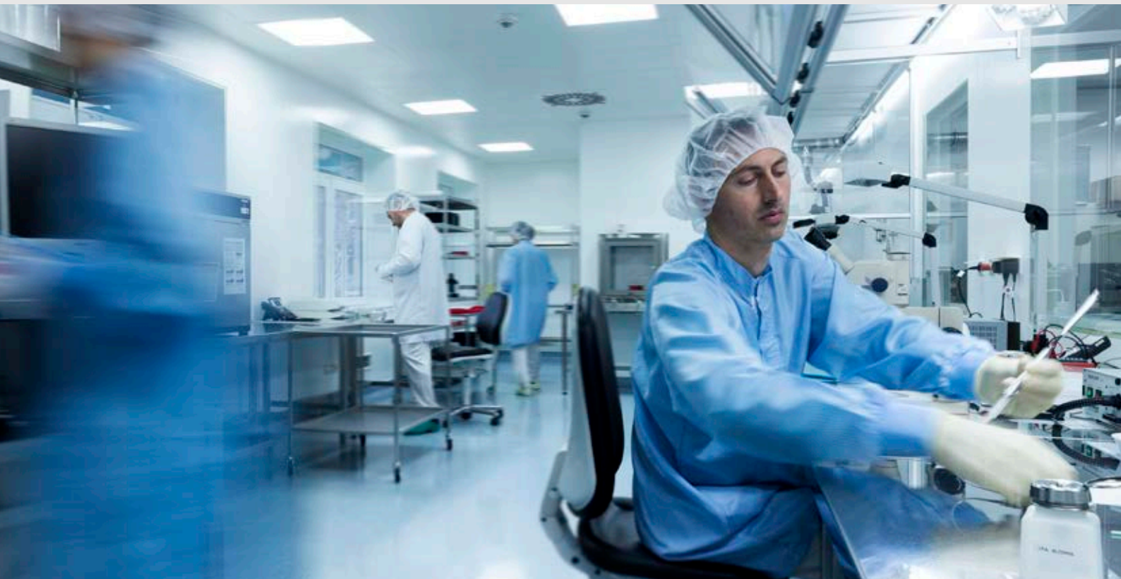
Blick in den Reinraum bei WITTENSTEIN intens, in dem der Verlängerungsmarknagel FITBONE® hergestellt wird.