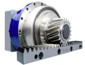
Servoaktuator TPM+ mit Ritzel-Zahnstange