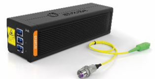
Optischer Sensor IDS3010 für Messungen im Nano-Bereich