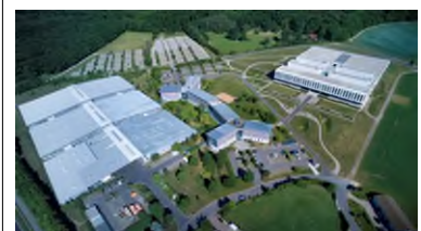
Firmensitz der WITTENSTEIN SE in Igersheim-Harthausen