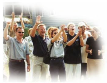
Heute wie damals: das wichtigste Kapital sind die Mitarbeiter

1999 feiert die Unternehmensgruppe erneut Richtfest, in nur 3 Jahren wird die Fläche in Harthausen mehr als verdoppelt: es kommen das Entwicklungs- und Vertriebs- sowie Schulungs- und Kommunikationszentrum sowie eine zweite Produktions- und Montagehalle und eine neue Logistikhalle dazu.