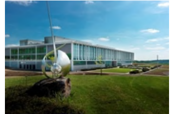
Offizielle Eröffnung im Mai 2014: Die WITTENSTEIN Innovationsfabrik in Igersheim-Harthausen.