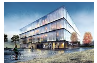
Die Software Factory