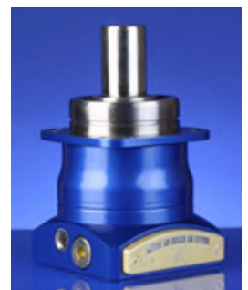
In den 90ern bereits die Vision – 2003 realisiert: das intelligente Getriebe alpheno® IQ