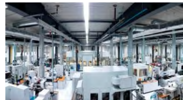
Blick in die „Urbane Produktion der Zukunft“ der WITTENSTEIN SE in Fellbach