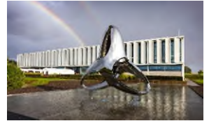
Logo-Skulptur vor der Innovationsfabrik