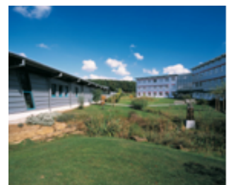
Weltgarten der WITTENSTEIN SE in Igersheim-Harthausen