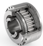
Das miniaturisierte Galaxie® eröffnet neue Möglichkeiten in der Medizinrobotik