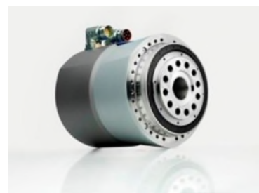
Das Galaxie® Antriebssystem von WITTENSTEIN: Weltneuheit und Gewinner des HERMES AWARD 2015