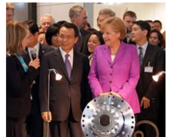
2009: Bundeskanzlerin Merkel auf dem WITTENSTEIN Messestand auf der Hannover Messe