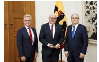
Das für den Deutschen Zukunftspreis 2018 nominierte Erfinderteam mit Bundespräsident Frank-Walter Steinmeier.