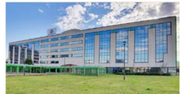
La sede di Sesto San Giovanni (MI) di WITTENSTEIN S.P.A.

I prodotti WITTENSTEIN ad alta tecnologia volano nell'universo e vincono le corse di Formula 1. Circa 2100 collaboratori sviluppano, producono e distribuiscono sistemi di azionamento intelligenti, dal più piccolo servosistema ad alte prestazioni al mondo, fino all'alta tecnologia del settore medicale. Con entusiasmo e passione fissiamo, ogni giorno, dei modelli di riferimento validi a livello mondiale.