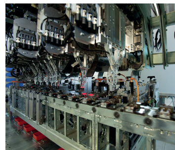
Anwendung in der Kleinteilmontage mit Taktzeiten im Sub-Sekunden Bereich