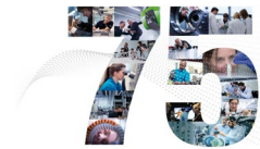
WITTENSTEIN – 75 Jahre in Bewegung

Die WITTENSTEIN SE entwickelt Produkte, Systeme und Lösungen für hochdynamische Bewegung, präziseste Positionierung und intelligente Vernetzung in der mechatronischen und cybertronischen Antriebstechnik.